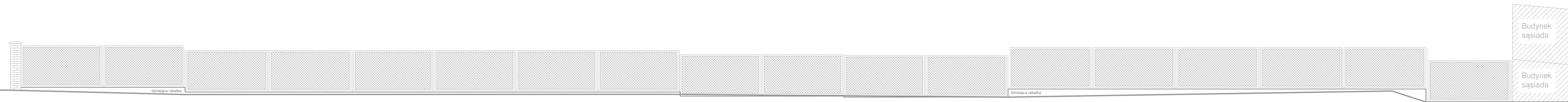
WIDOK OD STRONY DZ. NR 1020 - INWENTARYZACJA